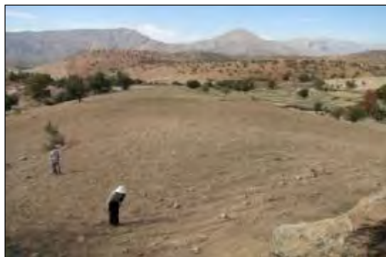
شکل ۴- محوطه مازنه نِسَه سرفنات (MK 169)، نمای عمومی، دید از شرق (خسروزاده ۱۳۸۸)

پهنه گودالو با چشم‌اندازی تپه‌ماهوری در یک و نیم کیلومتری جنوب‌غرب روستای پولک و ۷۰۰ متری شمال دریاچه سد کارون ۴، در منطقه‌ای معروف به گودالو قرار گرفته است. این منطقه یکی از ماندگاه‌های موقتی عشایر است که چند وارگه عشایری نیز در آن دیده می‌شود. این منطقه از سوی جنوب به منطقه برد زرد، از جنوب‌شرق به دره عمیق روستاهای پولک و زینب خاتون، از غرب به جاده آسفالت شهرکرد به خوزستان و از سوی جنوب به دریاچه سد کارون ۴ محدود است. محوطه گودالو ۴ (MK 394) در این پهنه قرار گرفته است. این محوطه اساساً از نوع محوطه‌های روباز است و پراکندگی دست‌ساخته‌های سنگی و سفال در آن دیده می‌شود. این محوطه بر سطح پشته‌ای کم ارتفاع در بخش جنوبی منطقه گودالو قرار گرفته است. این پشته از چهارسو با شیب ملایمی به تپه‌ماهورهای اطراف منتهی می‌شود. بخش‌های زیادی از سطح محوطه شخم خورده و به زیر کشت گندم رفته است. بر سطح محوطه شمار فراوانی سنگ‌های قلو و لاشه کوچک و بزرگ دیده می‌شود. پراکندگی دست‌ساخته‌های سنگی بر سطح محوطه نسبتاً کم ولی سفال زیاد است و بیشتر در بخش شمالی و غربی محوطه دیده می‌شود. بیشترین پراکندگی سفال و دست‌ساخته‌های سنگی بر سطح، محدوده‌ای به ابعاد ۸۰×۶۰ متر است اما با توجه به احتمال مدفون شدن دست‌ساخته‌ها در زیر رسوبات و لگدکوب شدن بر اثر حرکت مداوم دام‌های کوچ‌نشینان، و شخم مداوم سطح محوطه، محدوده اصلی شاید بزرگ‌تر باشد.