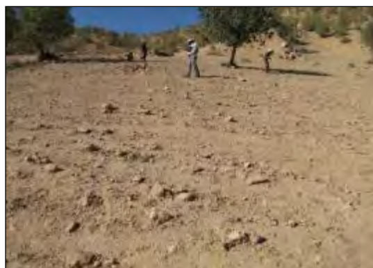
شکل ۳- محوطه سرکول سرمازه ۶ (MK 132)، نمای عمومی، دید از شرق (خسروزاده ۱۳۸۸)

هلوسعد ۲ (MK 112)، تنگ شیرکشته ۱ (MK 113)، ماشک کالی سرمازه (MK 125)، سرکول سرمازه ۳ (MK 129)، سرکول سرمازه ۵ (MK 130)، سرکول سرمازه ۶ (MK 132) (شکل ۳)، سرکول سرمازه ۷ (MK 133)، آب گرازی ۱ (MK 135)، بیدسوخته ۴ (MK 144)، نسه سرمازه ۱ (MK 153)، نسه سرمازه ۲ (MK 154)، وقفی (MK 155) دره‌گوشه (MK 163) توله‌دان ۲ (MK 67)، توله‌دان ۵ (MK 70) و شترخوس (MK 85) اشاره کرد.