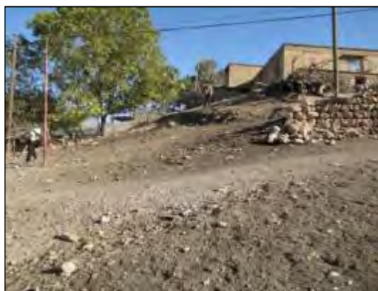
شکل ۲- محوطه ملک‌شیر ۵ (MK 109)، نمای عمومی، دید از شمال (خسروزاده ۱۳۸۸)

سرکول‌سرمازه (۳ و ۴ و ۶ و ۷) در نزدیکی سنگ‌چین وارگه‌های عشایری است. برخی از این وارگه‌ها قدمتی طولانی دارند. ساختار معماری آن‌ها بیشتر مدور است. آنچه در مورد این محوطه‌ها و وارگه‌های عشایری نزدیک آن برداشت می‌شود درک و آگاهی مشترک کوچ‌نشینان پیش از تاریخ و دوران تاریخی با طیف زمانی متفاوت از مکان استقرار و گزینش بهترین مکان برای برپایی یک زندگی فصلی است. جایی که این دو گروه برای استقرار انتخاب کرده‌اند کم‌شیب‌ترین و بهترین نقطه این دره کوچک است. این محوطه‌ها در دره‌ای معروف به لیلبنو (لاله انبوه) قرار گرفته‌اند. در میان این دره بستر رود فصلی کوچکی دیده می‌شود که هم‌اکنون خشک است. پوشش سطح این محوطه نسبت به دیگر پشته‌های اطراف که پوشش جنگلی نسبتاً انبوه دارد، کمتر است و گیاهان مرتعی مناسبی برای چرای دام بر سطح خود دارند. محوطه‌های (MK 132)، و (MK 133)، نهشته‌های باستانی اندکی دارند و چون بر دامنه‌ی شیب‌دار پشته قرار گرفته بر اثر جریان آب فرسایش پیدا کرده و به نظر می‌رسد نهشته‌های باستانی به زیر رسوبات رفته است. ویژگی مشترک محوطه‌های کوچ‌نشینی دره سرخون- هلو سعد وجود قلوه‌سنگ و لاشه‌سنگ‌های پراکنده بر سطح و اطراف آن‌ها است.