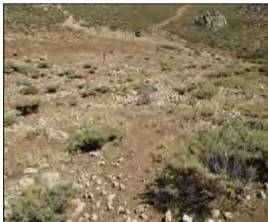
شکل ۵- محوطه دوپیه شلیل ۱۰ (MK 309)، نمای عمومی، دید از غرب (خسروزاده ۱۳۸۹)