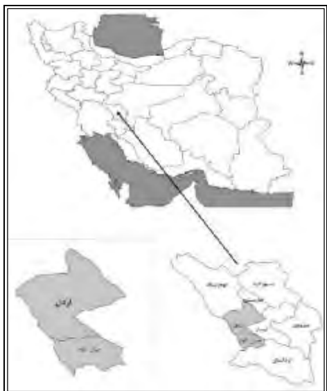
شکل ۱- موقعیت شهرستان اردل روی نقشه استان چهارمحال و بختیاری

با توجه به کوه‌های بلند و دره‌های عمیق در این شهرستان، محوطه‌های این دوره تا ارتفاع ۲۵۰۰ متر و حتی بالاتر دیده می‌شود؛ استقرار دایم در این محل کمتر دیده می‌شود و احتمالاً بیشتر محوطه‌ها استقرار موقت هستند.